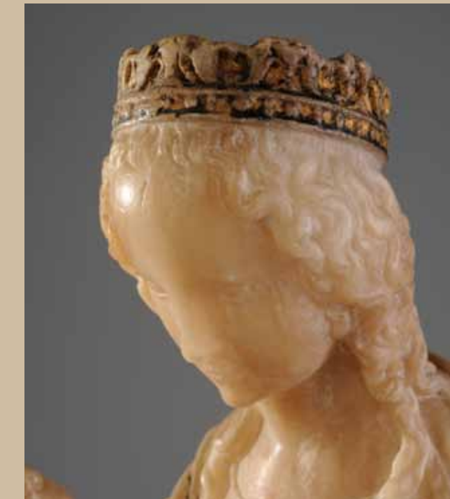
EL DIÁLOGO CON LO INVISIBLE EL ARTE AL ORIGEN DE EUROPA

Around ninety treasures of our heritage, civil and religious silverworks, marble, ivory and wood sculpture, paintings, manuscripts, fabrics and coins shed light on ten centuries of history and on the complex links between the European regions in the field of arts. The artists attempted to reach perfection on a technical point of view as well as high refinement. Their aim was to show their attachment to an invisible and inspiring superior force. While visiting this exhibition, which was awarded the "Belgian Presidency 2010" label, you will certainly be filled with emotion and wonderment.