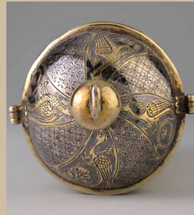
DIALOG MIT DEM UNBEKANNTEN DIE KUNST AM ANFANG EUROPAS

Een negentigtal schatten van ons patrimonium, burgerlijke en kerkelijke edelsmeedkunst, beeldhouwwerken in marmer, ivoor en hout, schilderijen, manuscripten, stoffen en muntstukken lichten tien eeuwen geschiedenis toe en illustreren de complexe banden die tussen de Europese regio's gewoven werden op het domein van de kunst. Hun auteurs hebben gezocht om de technische perfectie en die uiterste verfijning te bereiken. Ze getuigen van hun gehechtheid aan een onzichtbare en inspirerende hogere macht. Emoties en verrukkingen zijn alomtegenwoordig op deze uitzonderlijke tentoonstelling die de label van "Belgisch Voorzitterschap 2010" kreeg.