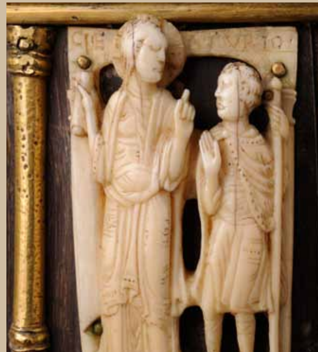
DIALOOG MET HET ONZICHTBARE DE KUNST IN DE OPBOUW VAN EUROPA

Une nonantaine de trésors de notre patrimoine, orfèvreries civiles et religieuses, sculptures en marbre, ivoire et bois, peintures, manuscrits, tissus et monnaies jalonnent dix siècles d'histoire et mettent en lumière les liens complexes entretenus entre les régions européennes dans le domaine artistique. Leurs auteurs ont cherché à atteindre la perfection technique et le raffinement au suprême degré. Ceux-ci témoignent de leur attachement à une force supérieure invisible et inspiratrice. Émotions et émerveillement sont au rendez-vous dans cette exposition exceptionnelle qui a reçu le label "Présidence belge 2010".