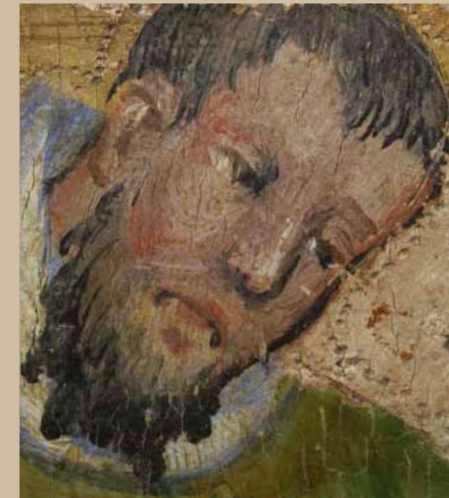
DIALOGUE WITH THE INVISIBLE ART AT THE SOURCES OF EUROPE

Ungefähr 90 Schätze unseres Denkmalschutzes, zivile und religiöse Goldschmiedearbeiten, Skulpturen aus Marmor, Elfenbein und Holz, Gemälde, Manuskripte, Stoffe und Münzen prägen 10 Jahrhunderte Geschichte und weisen auf die vielseitigen Verbindungen hin, die zwischen den europäischen Regionen im Bereich der Kunst gepflegt wurden. Ihre Autoren versuchten die technische Perfektion zu erreichen und das Raffinement im höchsten Grade. Diese beweisen ihre tiefe Neigung zu einer unsichtbaren und erleuchtenden höheren Macht. In dieser einmaligen Ausstellung, die das Gütezeichen "Présidence belge 2010" bekam, begegnen sich Emotionen und Bewunderung.