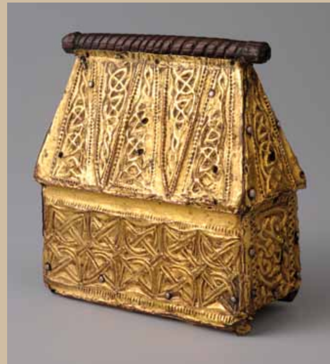
DIALOGUE AVEC L'INVISIBLE L'ART AUX SOURCES DE L'EUROPE

Une nonantaine de trésors de notre patrimoine, orfèvreries civiles et religieuses, sculptures en marbre, ivoire et bois, peintures, manuscrits, tissus et monnaies jalonnent dix siècles d'histoire et mettent en lumière les liens complexes entretenus entre les régions européennes dans le domaine artistique. Leurs auteurs ont cherché à atteindre la perfection technique et le raffinement au suprême degré. Ceux-ci témoignent de leur attachement à une force supérieure invisible et inspiratrice. Émotions et émerveillement sont au rendez-vous dans cette exposition exceptionnelle qui a reçu le label "Présidence belge 2010".