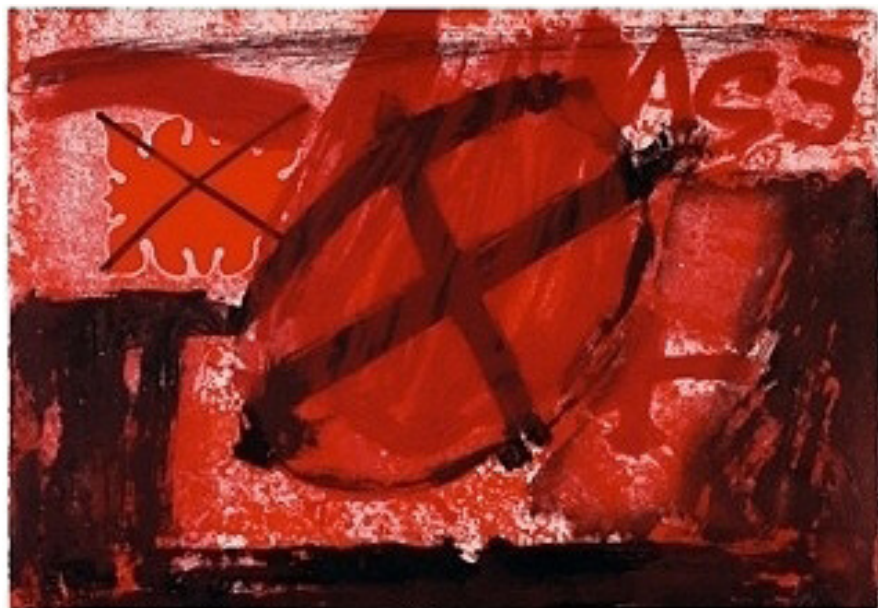
Antoni Tàpies, Cercle Rouge, 1980, eau-forte, aquarelle au sucre tirée en couleurs sur fond peint manuellement au rouleau sur Vélín d'Arches, 62 x 93 cm