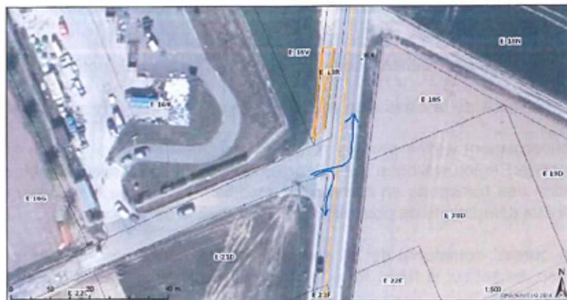
Rue de Ciney - Stationnement camion en sortie du parc à containers

Considérant ce contexte et la visibilité qui en résultent (cf. plan et photographies ci-après) ;