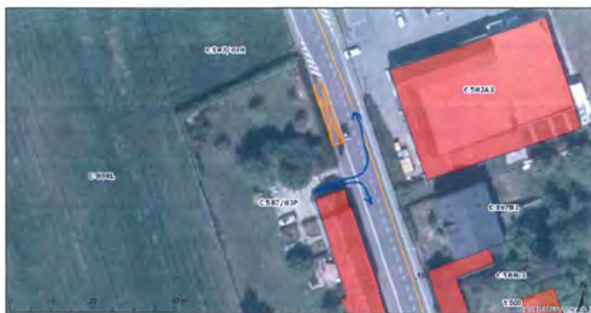
Emplacement du car scolaire (en orange) bloquant la visibilité en sortie de la parcelle C50703P : le tourne à gauche et le tourne à droite (en bleu).